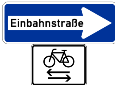
Zeichen 220 Einbahnstraße mit Zusatzschild