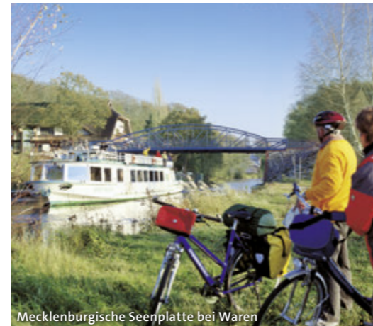
Mecklenburgische Seenplatte bei Waren