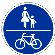
Zeichen 240 Gemeinsamer Geh- und Radweg

Hier verlaufen Rad- und Gehweg nebeneinander. Das Schild steht meist zwischen den beiden Wegen. Radfahrende dürfen nicht auf den Gehweg ausweichen, auch nicht zum Überholen.