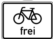
Zeichen 239 Gehweg mit Zusatzschild „Radfahrer frei“