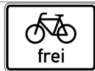
Zeichen 242 Fußgängerzone mit Zusatzschild „Radfahrer frei“