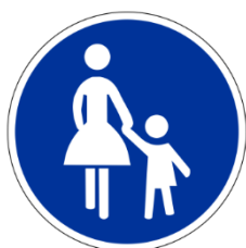
Zeichen 239 Gehweg