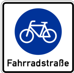
Zeichen 244 Fahrradstraße