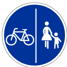
Zeichen 241 Getrennter Rad- und Gehweg