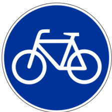
Zeichen 237 Radweg

Fußgänger, Inline-Skater (falls nicht durch Zusatzzeichen zugelassen), Motorräder, Autos. Kraftfahrzeuge dürfen auf Radwegen nicht fahren, halten oder parken.