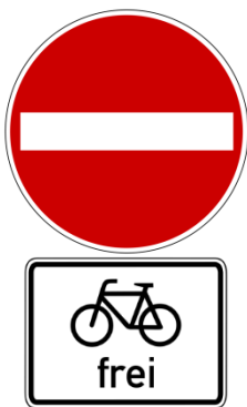
Zeichen 267 Verbot der Einfahrt mit Zusatzschild